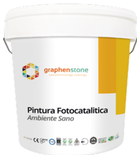
Representación gráfica del envase original. El contenedor original pudiese variar en color, diseño y envase.